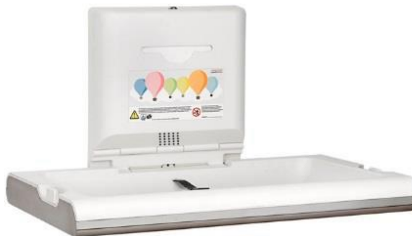
Fasciatoio per bambini